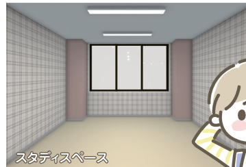
スタディスペース

泉みらい児童クラブは県内に8箇所の児童クラブを運営する久楽会が「民設民営」の専用施設として、金沢市の指導と補助の下で運営します。