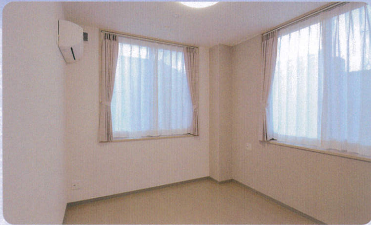
日当りのよいお部屋でのんびり気ままに。