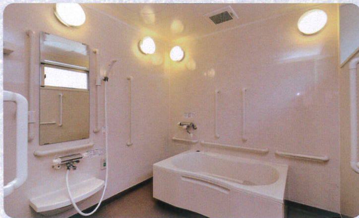
お風呂はもちろん好きな時間にのんびりと。